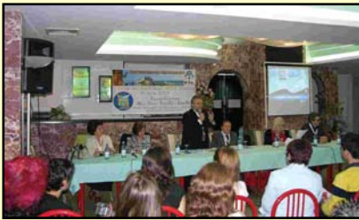
Convegno sui Giornali scolastici e Video (Sez. A e B)