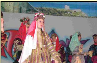
Folklore:: Polinas Industry Vocational Hig School- Manisa (Turchia) (Sez. C)