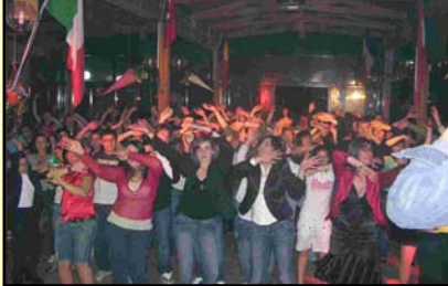
Serata di Gala. "tutti insieme allegramente"