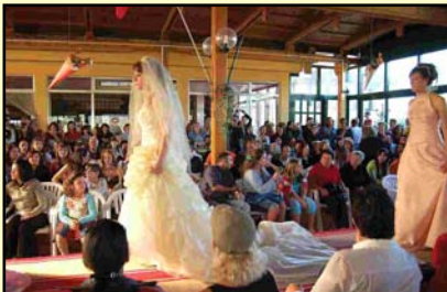
Sfilata di Moda (Sez. C)