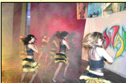
Danza sportiva (Se C)